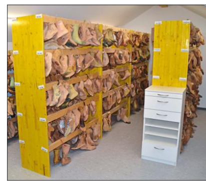
Im Lager sind Schuhleisten mehrerer Generationen untergebracht.

wie eine Fußbodenheizung verbaut. Der Strom dafür wird von einer Photovoltaikanlage auf dem neuen Dach erzeugt und fließt in einen Stromspeicher. „Wir sind quasi autark“, sagt Pichler. So entsteht beispielsweise dank Wärmerückgewinnung kaum ein Energieverlust, wenn die dezentrale Lüftungsanlage zweimal täglich das komplette Luftvolumen der Werkstatt umwälzt. Und Geruchsbelästigungen, sei es durch Klebstoff oder Käsefüße, werden vermieden.