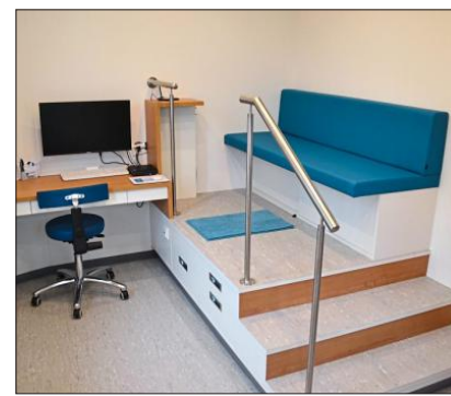
Im vorderen Bereich des Anbaus befindet sich einer der Maßräume.

Außerdem wurde das gesamte Gebäude im Rahmen der Bauarbeiten energetisch saniert. Es wurden eine Lüftungs- und Klimaanlage so-